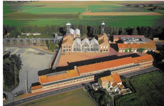
Luchtfoto van het Centre Historique Minier

Het Centre Historique Minier, opgericht in juli 1982, bestaat uit drie complementaire afdelingen: een mijnmuseum, een archief- en documentatiecentrum en een Cultureel wetenschappelijke energiecentrum (CCSE). De locatie, die twee jaar later in mei 1984 wordt geopend, verwelkomt dat jaar 17.594 bezoekers.