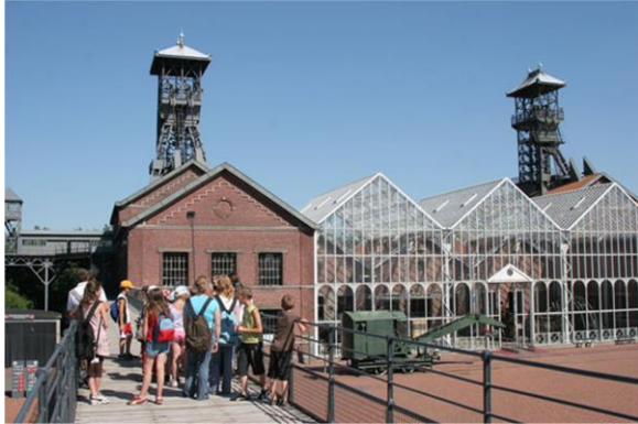
Uitzicht op de locatie vanaf de Passerelle(= bruggetje)

Het Centre Historique Minier ligt in Lewarde, 8 km ten oosten van Douai in het noorden en in het hart van het mijnbekken. Het is ingericht op de mijntegel van de voormalige put van Delloye, met 8.000 m 2 industriële gebouwen en bovenbouw, op een terrein van 8 hectare. Het is geïdentificeerd als een historisch monument en is een van de opmerkelijke locaties van het mijnbekken, dat behoort tot het Unesco werelderfgoed.