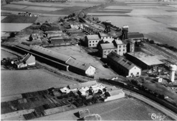
Luchtfoto van de put van Delloye, circa 1950-60

De put Delloye van de voormalige Compagnie des Mines d'Aniche begint zijn werk in 1931. In dat jaar werd 18.634 ton steenkool gewonnen. Het tonnagerecord werd bereikt in 1963, met 1.218 ton gewonnen per dag. De steenkool is moeilijk te exploiteren, de laag wordt onrendabel en de exploitatie stopt in 1971.